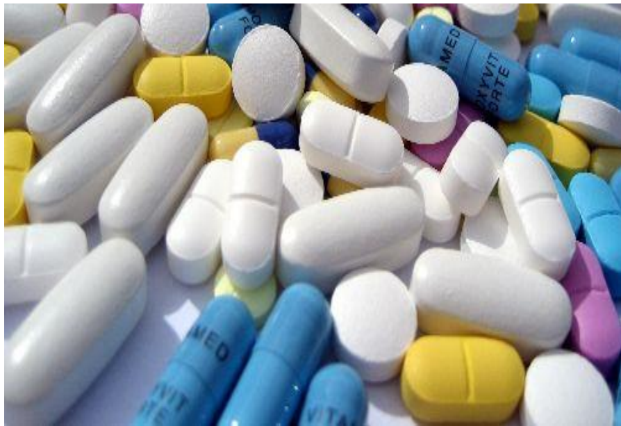
FARMACEUTICA: produce farmaci e medicine